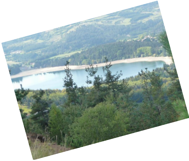
Le lac d'Issarlès